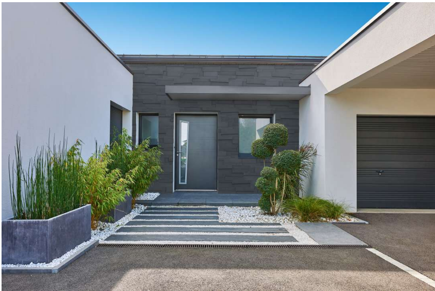
Collection Statur, ton anthracite