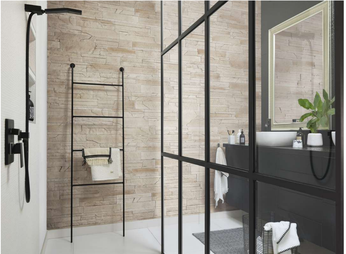
Collection Portland, ton naturel

Deux modes de pose - en opus et en ligne - sont possible et deux coloris - ton naturel et terre d'argile - sont disponibles pour répondre aux goûts de chacun.