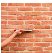
3 - Applico l'idrorepellente solo per l'esterno

ATTREZZATURA NECESSARIA : Spatola dentata 9x9x9, cazzuola, livello, matita, secchio, miscelatore, malta pronta all'uso ORSOL o malta adesiva ORFLEX, malta stucco per muri ORSOL, sac à poche, spruzzatore e idrorepellente (solo per la posa esterna).