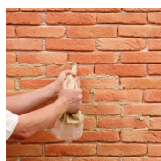
2 - Stucco...