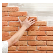
1 - Posa...

Per la posa utilizzare esclusivamente i prodotti accessori ORSOL: gli accessori ORSOL vi garantiscono un lavoro a regola d'arte e vi offrono la garanzia prodotto ORSOL. Per la posa e la cura del rivestimento non utilizzare mai prodotti acidi.