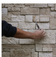
2 - J'élimine le surplus de colle