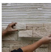
1 - Je pose

Ne jamais utiliser de produits à base d'acide pour la pose ou l'entretien.