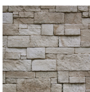
3 - J'hydrofuge pour l'extérieur

MATERIEL NECESSAIRE : Peigne 9x9x9, truelle, niveau, crayon, seau, malaxeur, colle ORFLEX, hydrofuge et pulvérisateur si pose en extérieur.